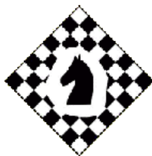
SF Schwerin e.V.