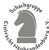
SG Eintracht Neubrandenburg