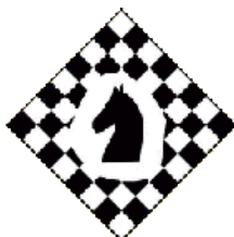
SF Schwerin e.V.